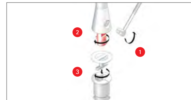
Der Poller kann so auch temporär entfernt werden.