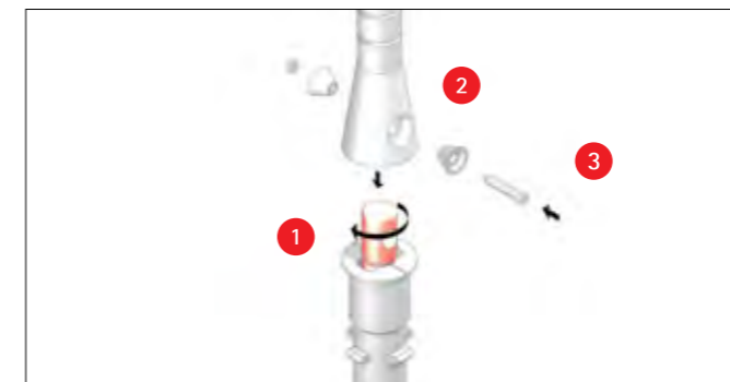
Das Verbindungsstück wird ausgetauscht.