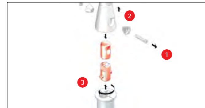
Das gebrochene Verbindungsstück wird gelöst und entfernt.