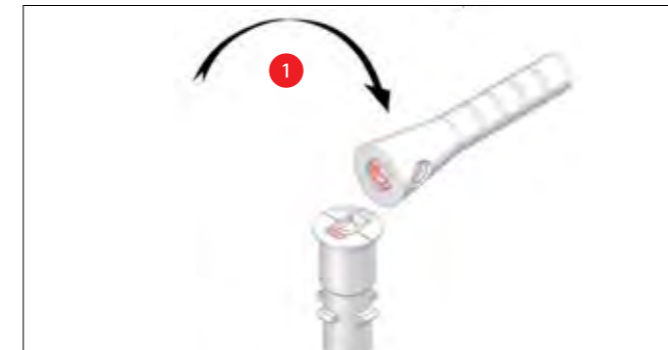
Das austauschbare Verbindungsstück bricht an der Sollbruchstelle.